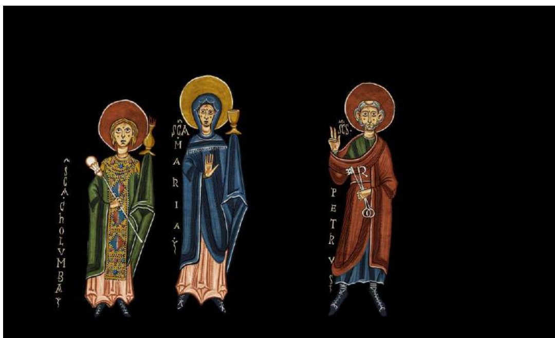
Detall del videomapatge de l'església de Santa Coloma.

La pintura mural és la protagonista indiscutible d'aquests monuments. Està ubicada generalment a la conca absidal, abraçant l'altar, el lloc més adient per representar-hi imatges teofàniques. A grans trets, el discurs pictòric s'organitza amb el Crist o la Verge, ubicats al quart d'esfera dels absis, i tota mena de figures complementàries.