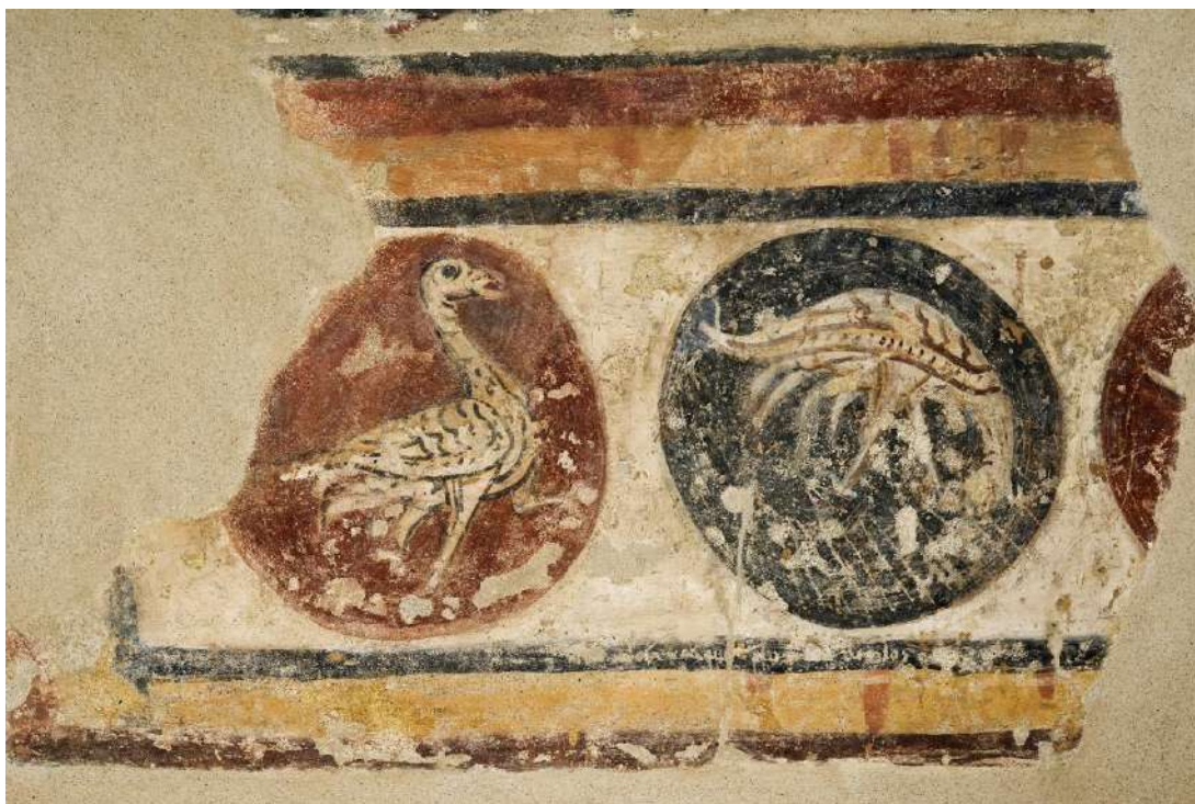
Detall d'una sanefa de les pintures murals originals de Santa Coloma.

Els artistes són artífexs que treballen en tallers , equips de treballadors de l'art, dedicats de manera més o menys especialitzada a un determinat procediment tècnic. La denominació de mestre no l'hem d'entendre com un únic personatge sinó com una "manera de fer" compartida per artífexs diversos.