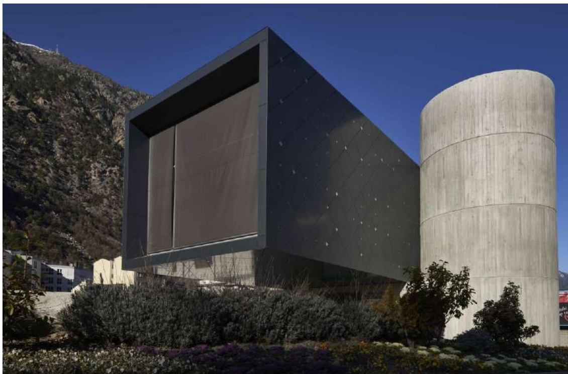
L'equipament museístic Espai Columba.

L'Espai Columba és un equipament cultural que té com a missió custodiar, conservar i presentar les pintures murals de l'absis de l'església de Santa Coloma i diversos objectes litúrgics provinents de les esglésies andorranes. Es tracta d'un centre difusor del coneixement de la pintura romànica a Andorra, sense oblidar el seu context arquitectònic i les altres manifestacions artístiques que formaven part de l'univers diví d'aquest estil artístic.